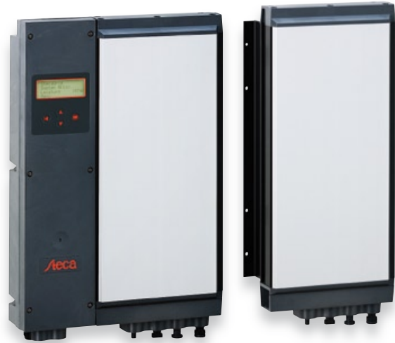
StecaGrid 2000+ Master