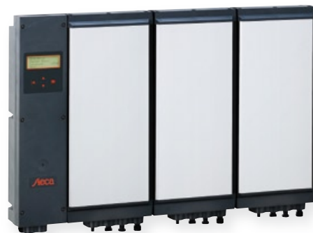
StecaGrid 2000+ Master und 2 StecaGrid 2000+ Slaves