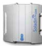
Soladin 2200 WEB