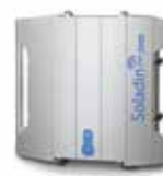
Soladin 3000 WEB