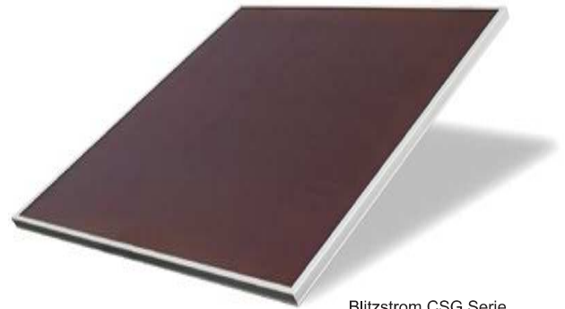
Blitzstrom CSG Serie

Lange Haltbarkeit - Selbst nach einer UV-Einstrahlung äquivalent zu mehr als 30 Jahren direktem Sonnenlicht zeigen die CSG-Module so gut wie keine Degradation. Bei konventionellen Modulen auf Wafer-Basis ist nach dieser Einwirkungsdauer eine Degradation von mindestens 5 bis 10 Prozent zu beobachten.