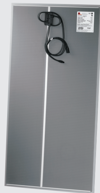
Solarmodul der Serie FS 2