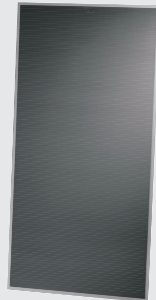
Solarmodul der Serie FS 2