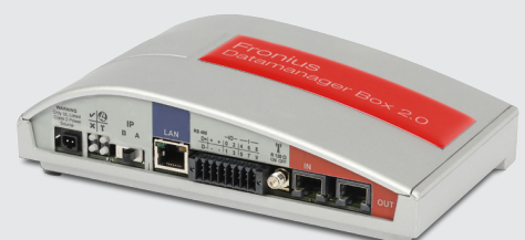
/ Fronius Datamanager Box 2.0

/ Komfortabler Support da der Fronius Datamanager den Wechselrichter direkt mit Fronius Solar.web verbindet.