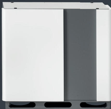
S10 SE BATTERIEFACH