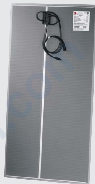
Solarmodul der Serie FS 2