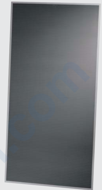
Solarmodul der Serie FS 2