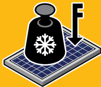
ROBUSTES UND NACHHALTIGES PRODUKTDISEIGN