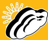
OPTIMIERT FÜR ALLE SONNENSCHENBEDINGUNGEN