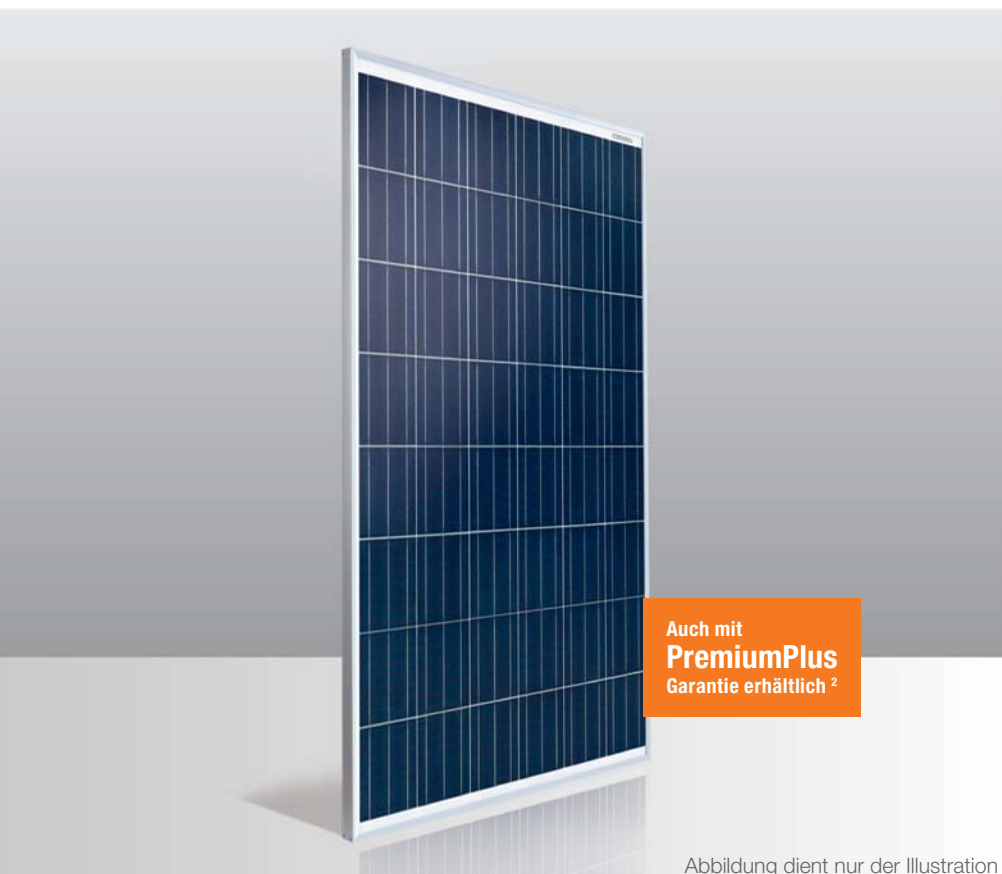
Abbildung dient nur der Illustration

Die Conergy PowerPlus Solarmodule bieten Premium-Qualität, die sich rechnet. Sie sind über die gesamte Laufzeit und auch unter anspruchsvollsten Umgebungs- und Witterungsbedingungen Garant für hohe Anlagenerträge und zuverlässigen Betrieb. Sie werden nach höchsten Qualitätsstandards gefertigt und zeichnen sich durch viele durchdachte Details und Eigenschaften aus, die in dieser Kombination Maßstäbe setzen.